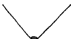
5 - средний