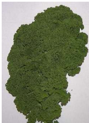
7 - сильная