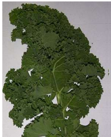
3 - слабая