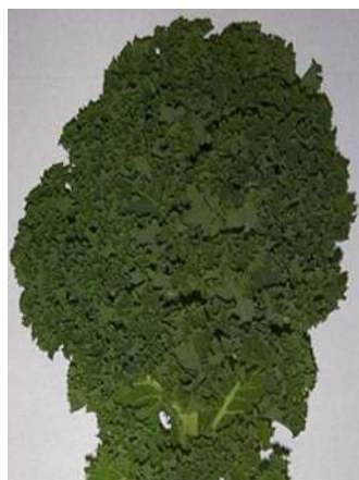
5 - средняя