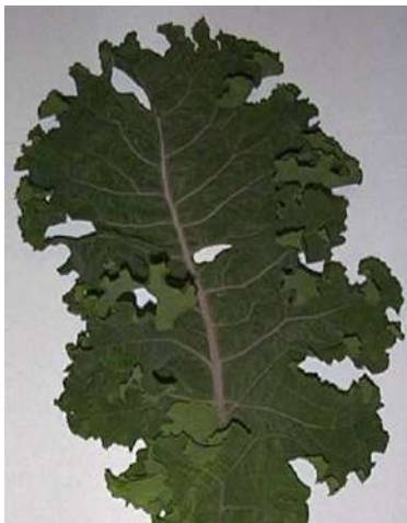
1 - отсутствует или очень слабая