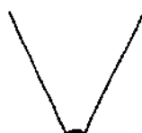
7 - сильный