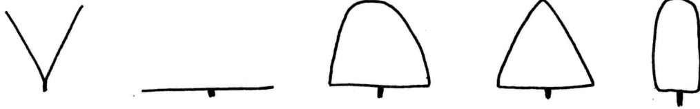
1 - перевернутая пирамида 2 - плоское 3 - куполообразное 4 - пирамидальное 5 - колонновидное